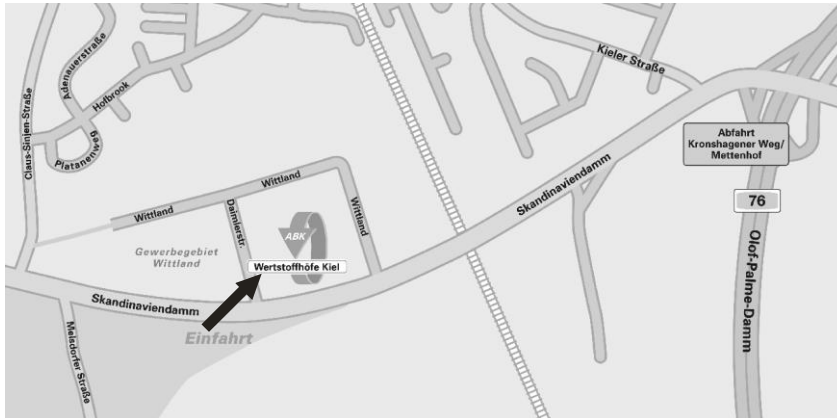
ABK-Wertstoffhof Daimlerstraße 2

Öffnungszeiten der beiden Höfe Mo - Fr 9.30 - 17.30 Uhr Sa 8.00 - 13.30 Uhr